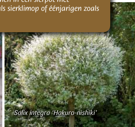
Salix integra 'Hakuro-nishiki'