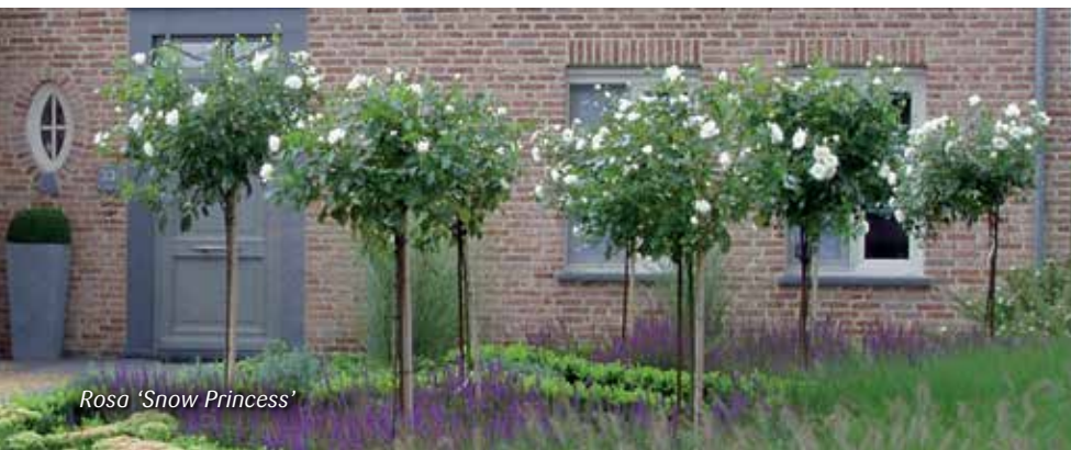
Rosa 'Snow Princess'

Combineer sierstammen in een sierpot met onderbeplanting zoals sierklimop of éénjarige zoals Surfinia's.