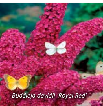
Buddleja davidii 'Royal Red'

Zorg voor bloei in alle seizoenen. Gebruik ook onze andere sierheesterfolders om een perfecte combinatie te creëren.