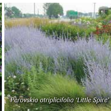
Perovskia atriplicifolia 'Little Spire'