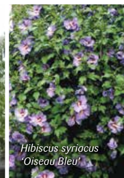
Hibiscus syriacus 'Oiseau Bleu'