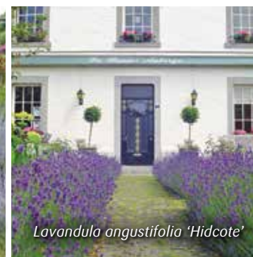
Lavandula angustifolia 'Hidcote'