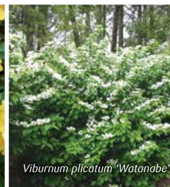
Viburnum plicatum 'Watanabe'