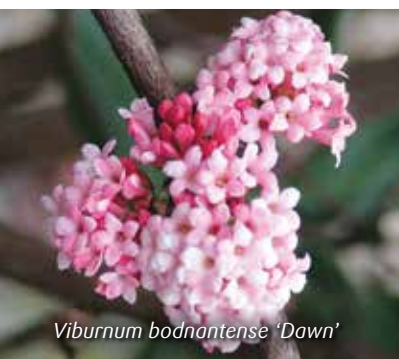
Viburnum bodnantense 'Dawn'

Zorg voor bloei in alle seizoenen. Gebruik ook onze andere sierheesterfolders om een perfecte combinatie te creëren.