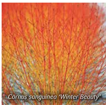
Cornus sanguinea 'Winter Beauty'