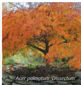
Acer palmatum 'Dissectum'