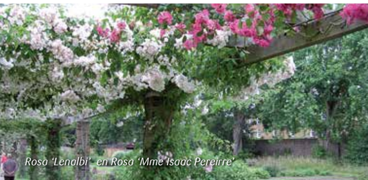
Rosa 'Lenalbi' en Rosa 'Mme Isaac Pereirre'

In het voorjaar snoei je de zwaardere takken terug tot 3 à 4 of 5 ogen boven de grond. De zwakkere snijd je weg. Hou steeds een vijftal takken over.