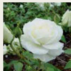
Rosa 'Snow Princess'