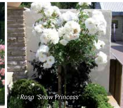
Rosa 'Snow Princess'