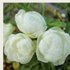
Rosa 'White Morsdag'