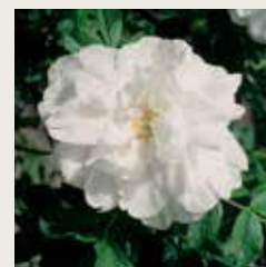
Rosa 'Blanc double de Coubert'