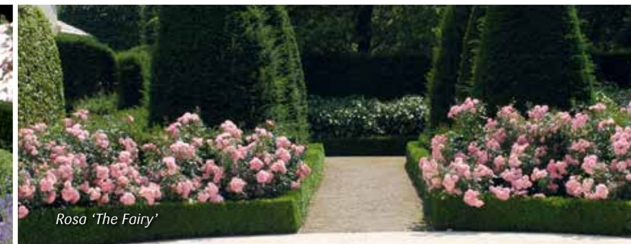
Rosa 'The Fairy'