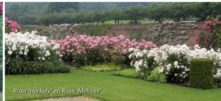
Rosa 'Harkuly' en Rosa 'Melrose'