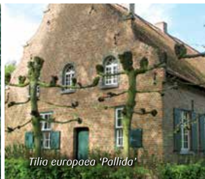
Tilia europaea 'Pallida'