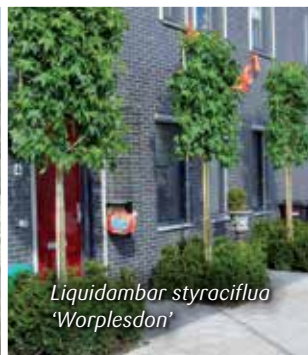
Liquidambar styraciflua 'Worplesdon'