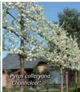
Pyrus calleryana 'Chanticleer'