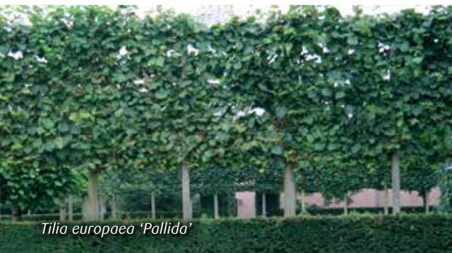
Tilia europaea 'Pallida'

Plant laagstammige fruitbomen voor het plukgemak (maximum 1,5 m tot 2 m). De meeste fruitbomen worden in een V of U-vorm aangeboden. Plant ze tegen een warme zuidmuur of als afscheiding in de tuin. Peren zijn de gemakkelijkste fruitsoort om in leivorm te houden.