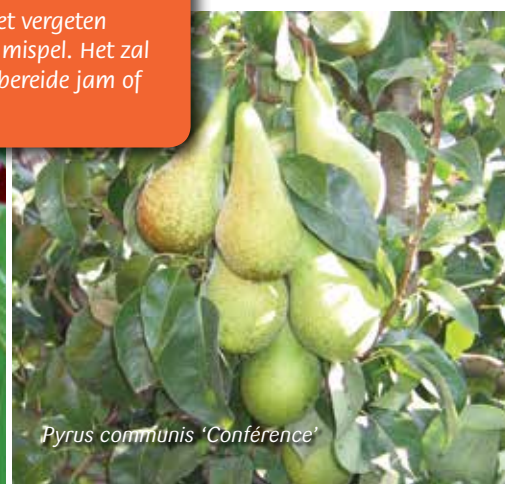
Pyrus communis 'Conférence'