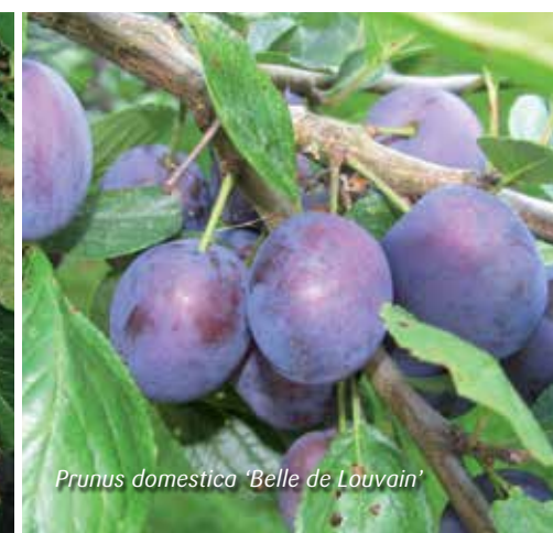
Prunus domestica 'Belle de Louvain'