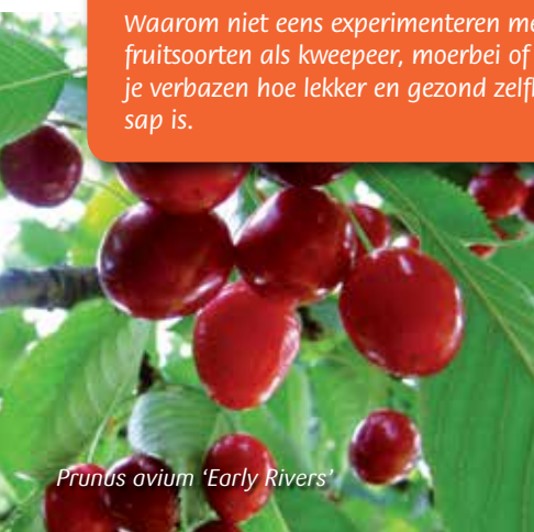
Prunus avium 'Early Rivers'