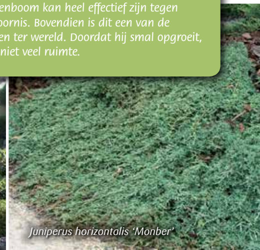
Juniperus horizontalis 'Monber'