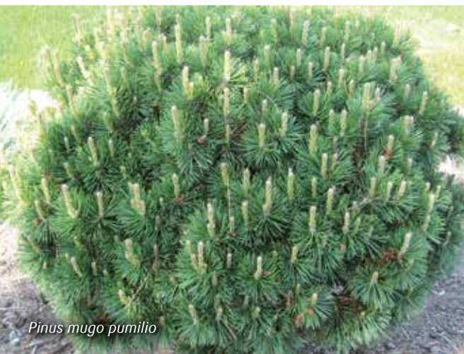
Pinus mugo pumilio

Thee gemaakt van de bladeren van de Japanse notenboom kan heel effectief zijn tegen geheugenstoornis. Bovendien is dit een van de oudste bomen ter wereld. Doordat hij smal opgroeit, verlangt hij niet veel ruimte.