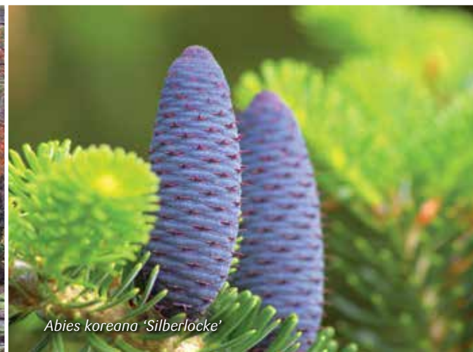
Abies koreana 'Silberlocke'