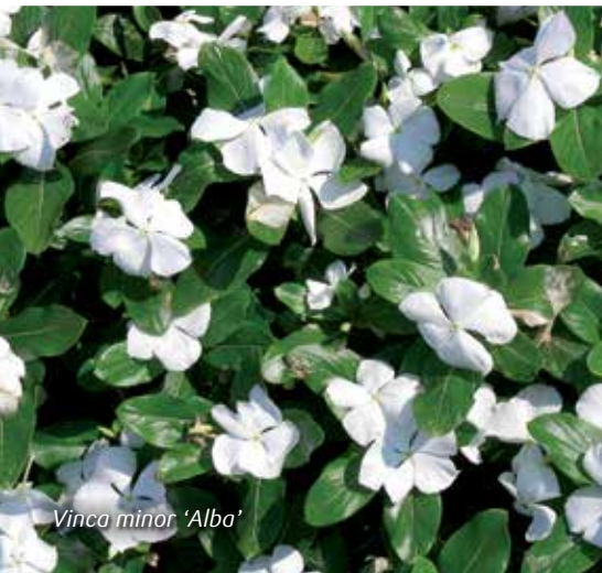
Vinca minor 'Alba'

Plant bloembollen tussen de bodembedekkers. Dit geeft een verrassend effect in het voorjaar.