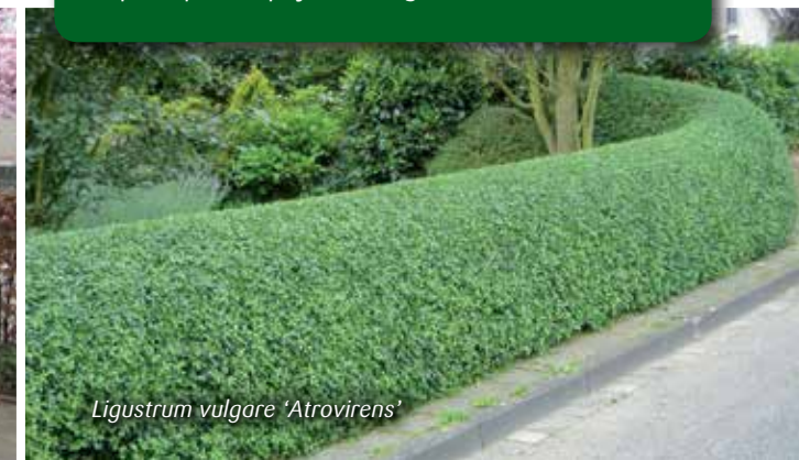
Ligustrum vulgare 'Atrovirens'