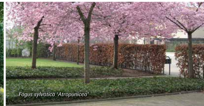
Fagus sylvatica 'Atropunicea'