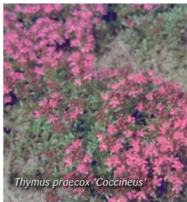
Thymus praecox 'Coccineus'