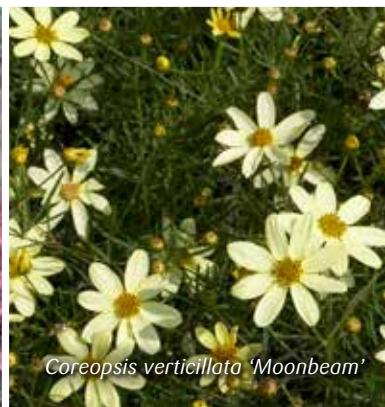
Coreopsis verticillata 'Moonbeam'