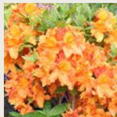
Rhododendron 'Glowing Embers'