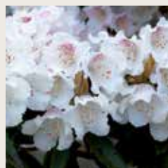
Rhododendron 'Koichira Wada'