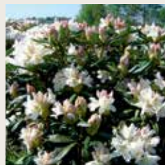
Rhododendron 'Cunningham's White'