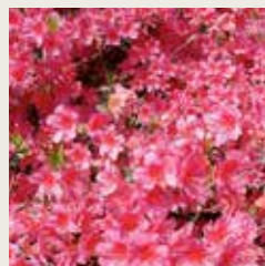
Rhododendron 'Amoena Leonardslee'