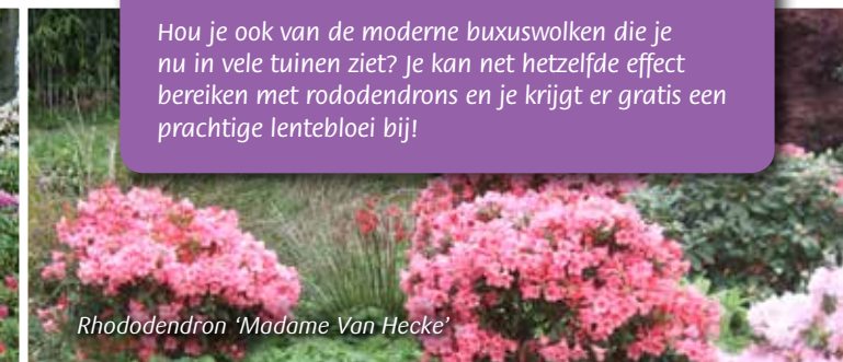
Rhododendron 'Madame Van Hecke'