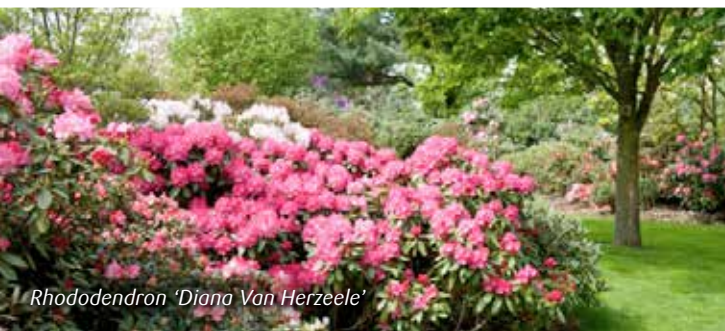
Rhododendron 'Diana Van Herzeele'

Hou je ook van de moderne buxuswolken die je nu in vele tuinen ziet? Je kan net hetzelfde effect bereiken met rododendrons en je krijgt er gratis een prachtige lentebloei bij!