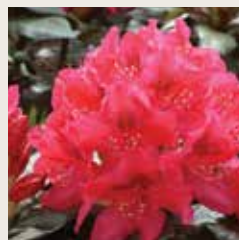
Rhododendron 'Nova Zembla'