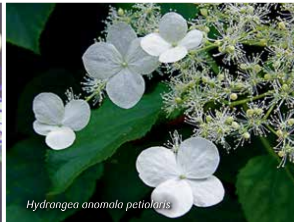
Hydrangea anomala petiolaris