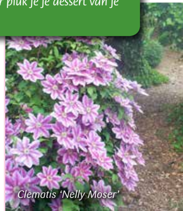
Clematis 'Nelly Moser'