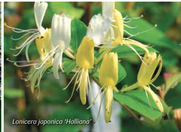
Lonicera japonica 'Halliana'