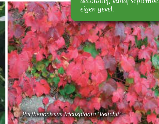
Parthenocissus tricuspidata 'Veitchii'