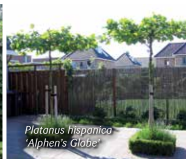
Platanus hispanica 'Alphen's Globe'