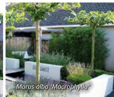
Morus alba 'Macrophylla'