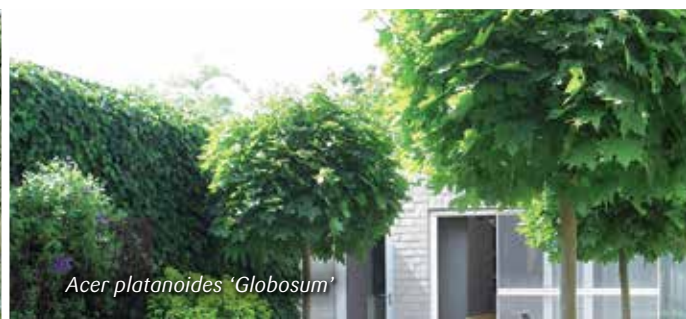
Acer platanoides 'Globosum'