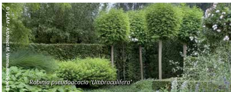
Robinia pseudoacacia 'Umbraculifera'