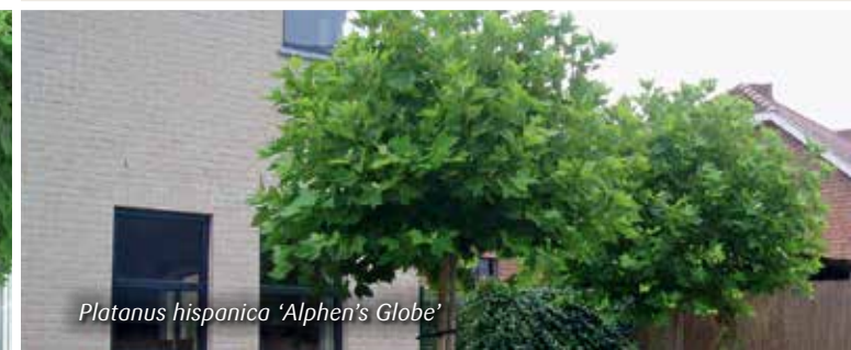
Platanus hispanica 'Alphen's Globe'