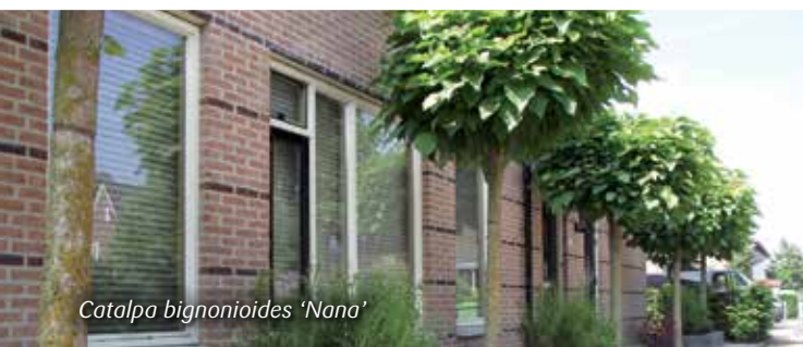
Catalpa bignonioides 'Nano'

Een zeer bloeirijke bolvorm. Het vijftallige blad is blauwachtig groen en kleurt in de herfst geeloranje. De bloemen zijn roze tot zalmkleurig (eind april – begin mei). Deze dwergpaardenkastanje wordt een 4-tal meter hoog en 2 à 3 m breed. Hij gedijt op iedere luchtige grond. Met deze boom creëer je het natuurlijk effect van een grote boom.